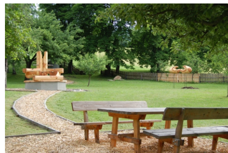
Der wunderschöne Schlossgarten bietet sich zum Fotografieren an!

Tarife: Trauungssaal: € 80,-- (übernimmt die Gemeinde); Bei weiterer Nutzung: Schlosshof für Agape: € 165,00; Schlosskapelle € 150,--; Lounge € 25,--