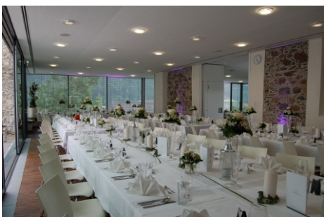
Mehrzweckraum: Schlechtwettervariante zum Schlosshof