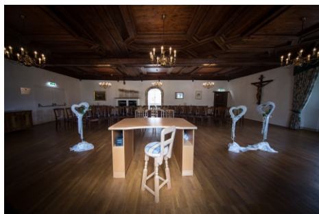
Der Trauungssaal mit seinen 119m 2 befindet sich im Obergeschoss des Schlosses.