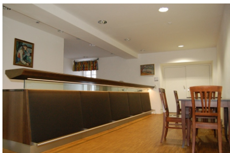
Schicke Lounge mit Zugang zum Rittersaal