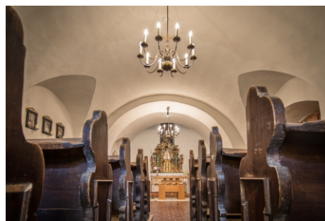
Die Schlosskapelle für die kirchliche Trauung.