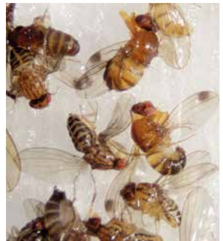
Kirschessigfliege „ Drosophila suzukii “

Rechtzeitige, regelmäßige und gründliche Ernte: Entfernung von reifen, überreifen und befallenen Früchten; keine Kompostierung befallener Früchte, da die Fliegen darin überleben. Anbringung von engmaschigen Netzen, sofern dies möglich ist. Anbringen von Apfelessigfallen: Man kann in Plastikgefäße (250 – 750ml) kleine Löcher hineinbohren (Ø 3-4mm), als Lockflüssigkeit wird naturtrüber Apfelessig mit Wasser 1:1 verdünnt und 2-3cm hoch in die Flasche gefüllt. Die Fallen sollen in der Nähe der Früchte an einem schattigen Platz angebracht werden.