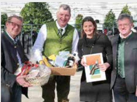
Die Abordnung der Gartenbauschule überreicht dem Jubilar die GOLDENE GARTENSCHERE