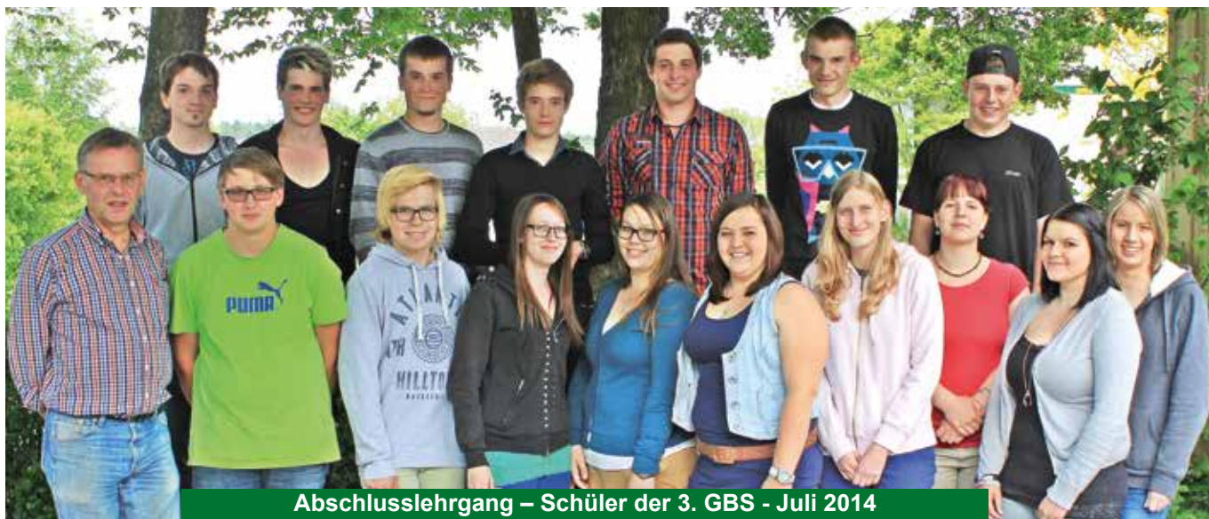
Abschlusslehrgang – Schüler der 3. GBS - Juli 2014