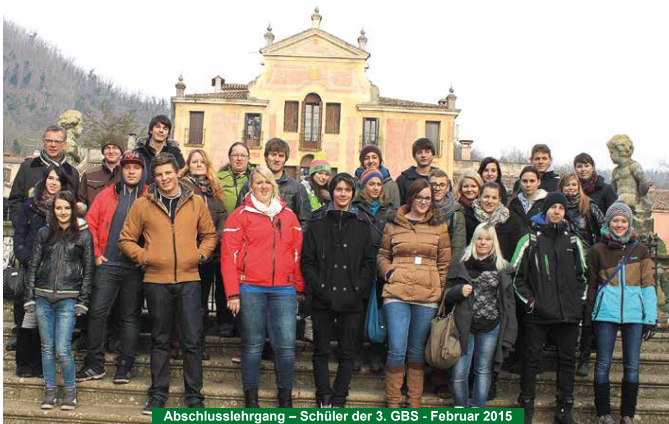
Abschlusslehrgang – Schüler der 3. GBS - Februar 2015