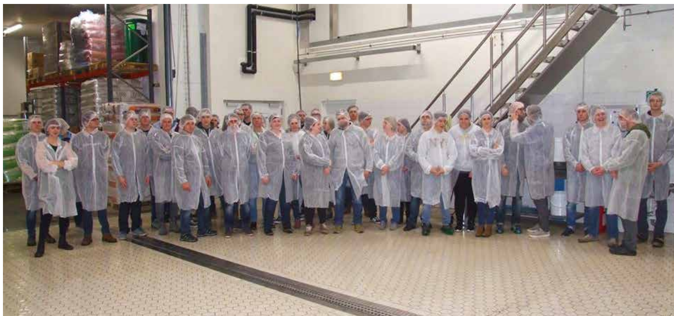
Winterseminar 2018 im Burgenland