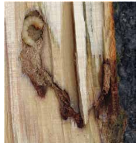
Laubholzbockkäfer im Holz