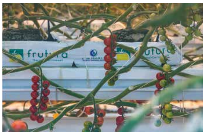
Produktion von Rispen Tomaten auf Kokosfaser