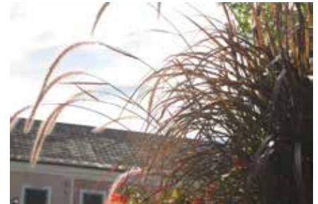
Pennisetum setaceum oder doch P. advena ?

Homepage der AGES ( https://www.ages.at/ ), des Pflanzenschutzdienstes ( http://www.pflanzenschutzdienst.at/ ) aber auch der Server des Landes Steiermark ( http://www.verwaltung.steiermark.at/cms/ziel/74835627/DE/ ) Ing. Heinz Salomon