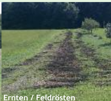
Ernten / Feldrösten