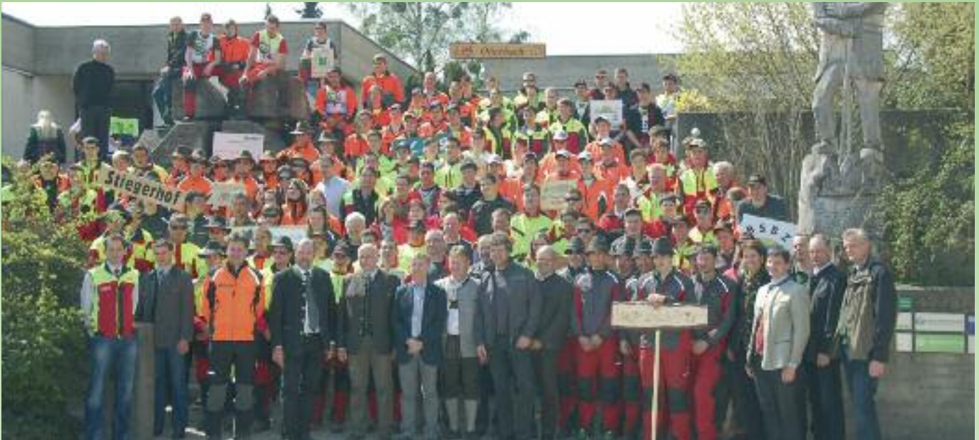
84 Schülerinnen und Schüler aus ganz Österreich nahmen an der Staatsmeisterschaft für Waldarbeit teil. Am Foto oben sind sie mit ihren Betreuern und den zahlreichen Ehrengästen zu sehen.