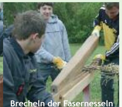
Brecheln der Fasernesseln