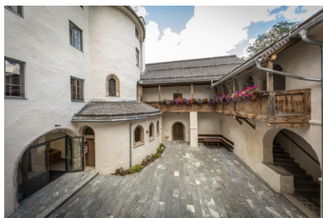
Schlosssinnenhof mit Ausgang zum Rittersaal. Nutzbar für Agape.