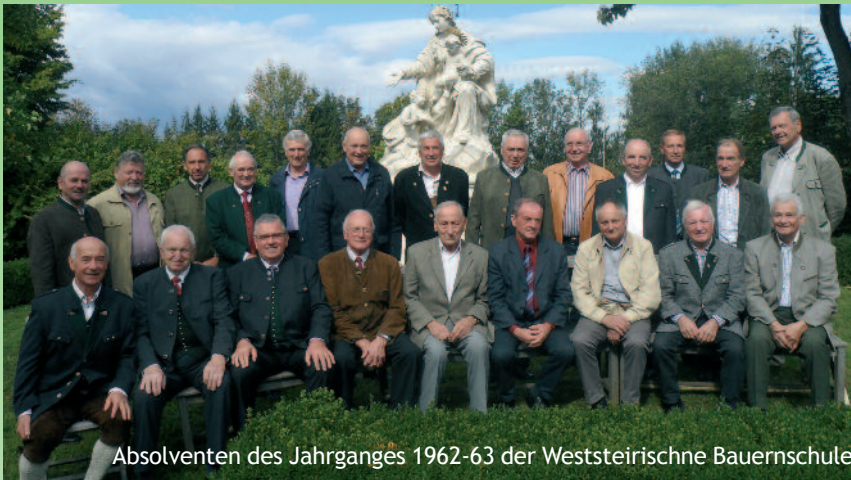
Absolventen des Jahrganges 1962-63 der Weststeirische Bauernschule

Kürzlich trafen sich die Absolventen des Jahrganges 1962-63 an ihrer damaligen Bildungsstätte Schloss Hornegg in Preding. Viele Jahre sind seit dem Ab-