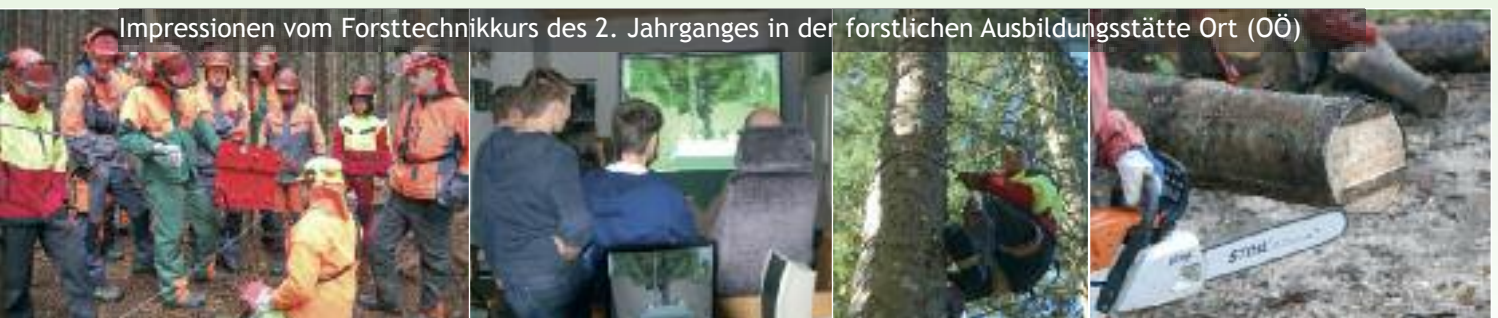
Impressionen vom Forsttechnikerkurs des 2. Jahrganges in der forstlichen Ausbildungsstätte Ort (OÖ)

Ich möchte mich an dieser Stelle dafür bedanken, dass ich hier an der Erzherzog Johann-Schule so herzlich aufgenommen wurde und hoffe, dass ich einen kleinen Beitrag zur guten Zusammenarbeit zwischen Schülern, Eltern und Kollegen leisten kann.