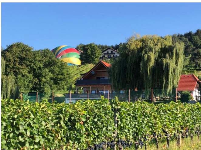
Buschenschank Hofer Toni, Zeil 190, 8223 Stubenberg