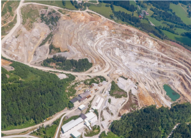
Talkabbau am Rabenwald feierte 200 Jahre Jubiläum