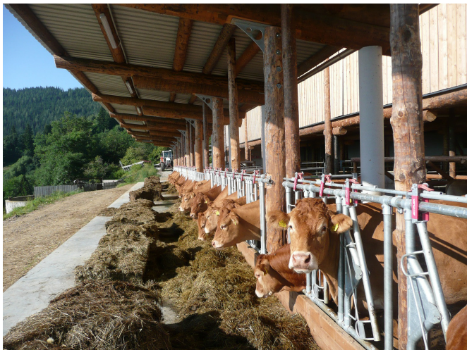
Stallneubau mit „Rundholzbauweise nach System Haberl“