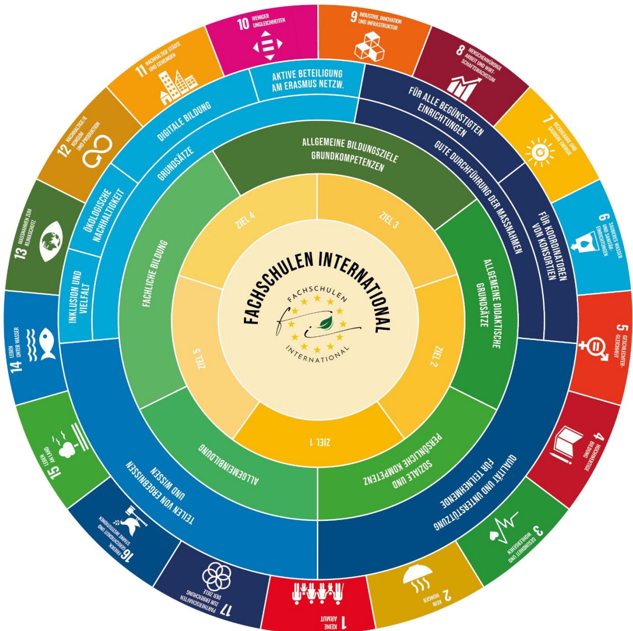
Abbildung 1: Ziele des Konsortiums in Verbindung mit den SDGs

Die untenstehende Grafik zeigt die strategischen Ziele des Konsortiums Fachschulen International in Verbindung mit den Sustainable Development Goals (SDGs) der Vereinten Nationen. Bei jeder Mobilität im Rahmen dieses Konsortiums muss mindestens eines der folgenden fünf Ziele verfolgt und im Learning Agreement entsprechend dokumentiert werden.